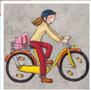
قيادة الدراجة الهوائية