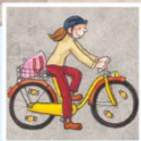
قيادة الدراجة الهوائية